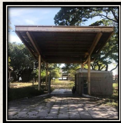
R. João Moreira Maciel, nº 370, B. Marcílio Dias – Porto Alegre/RS