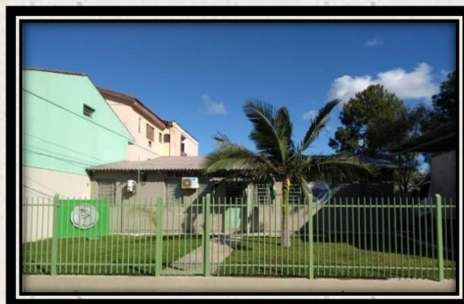
R. Antônio Gonçalves do Amaral, nº 1100, B. São José– Santa Maria/RS