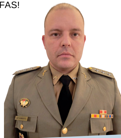
Cap QOEM Humberto Goulart Neto Comandante da EsFAS

Um aniversário é a celebração de um ciclo que se encerra e de outro que se anuncia, no entanto, quando um trabalho é brilhantemente realizado, espera-se e trabalha-se para que ele tenha continuidade. Que bem possamos preservar nossos valores éticos, morais e a qualidade de nosso ensino, para que possamos continuar a entregar à sociedade gaúcha profissionais militares que desempenhem com maestria e eficácia as habilidades que adquiriram neste liceu, colaborando na manutenção da ordem pública, no aprimoramento da segurança e na preservação da paz e da vida. Parabéns à EsFAS!