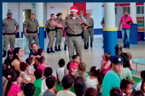
Natal Solidário realizado na EMEI Ivanise Jann de Jesus.