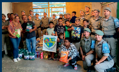
Doação de materiais realizada ao Centro de Desenvolvimento Comunitário Estação dos Ventos.

As ações sociais realizadas pela Escola de Formação e Aperfeiçoamento de Sargentos visam fortalecer o trabalho de aproximação com a comunidade, que é fator indispensável para prevenir a violência e preservar a paz.