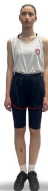
CT3 TAF com Regata