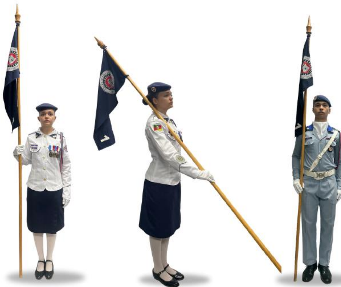
Aluna Porta-Símbolo usando uniforme CT1 com luva branca em tecido e alamar Guarda de Honra .