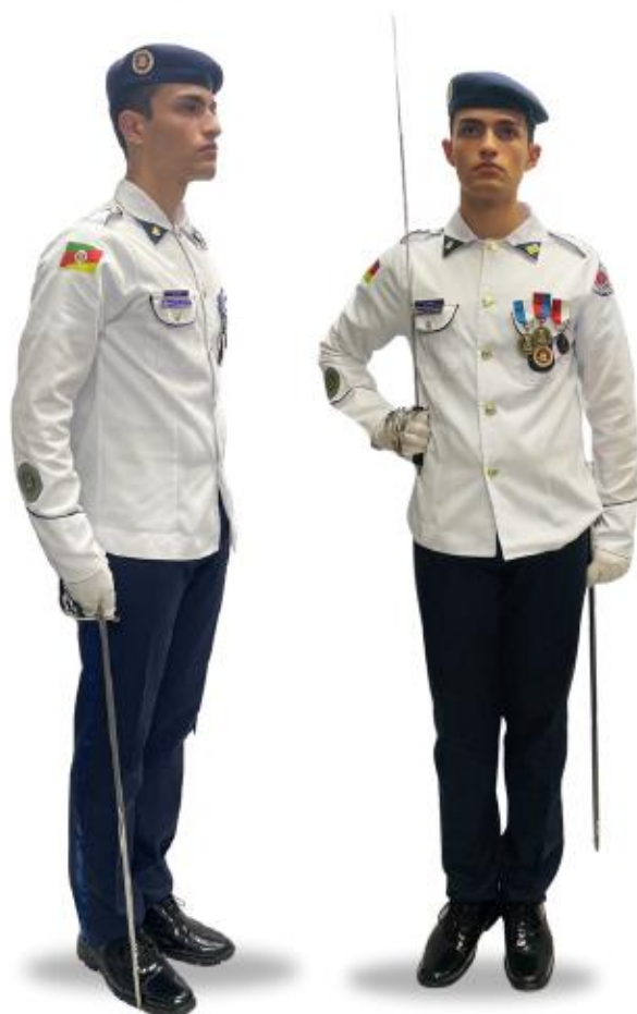
Aluno Disciplina usando uniforme CT1, guia de espada, espada CT e luva branca em tecido