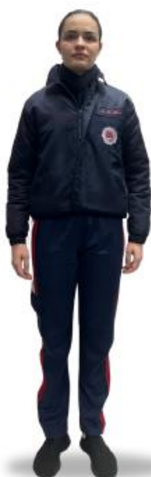
CT3 com Japona e Cachecol