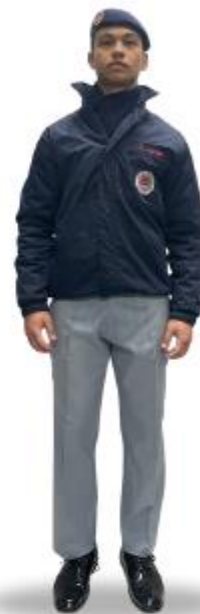
CT2i com Japona e cachecol