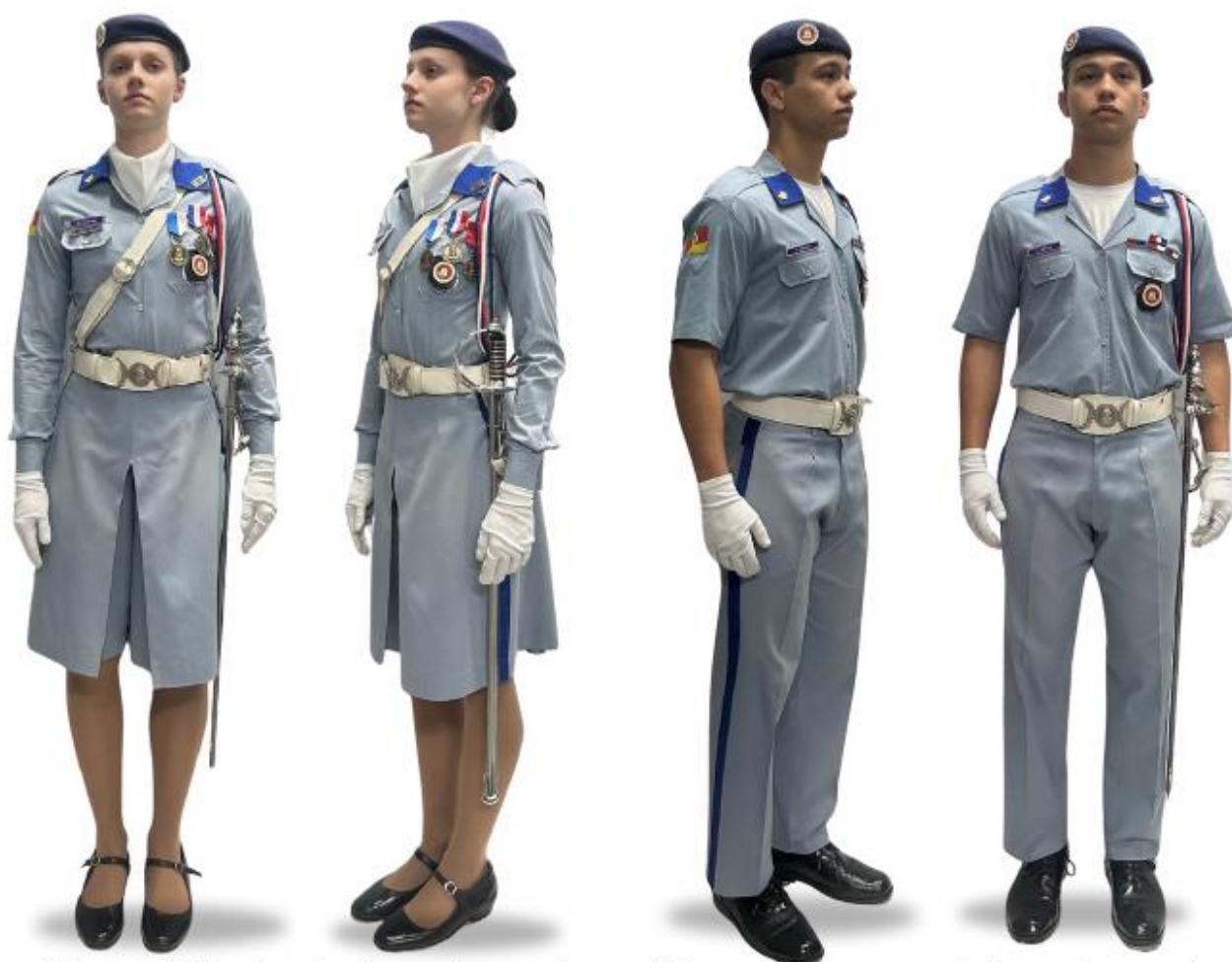
CT2i com Talabarte, guia de espada, espada e luva branca