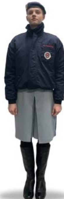
CT2i com Japona e cachecol