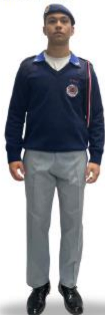
CT2i com Suéter