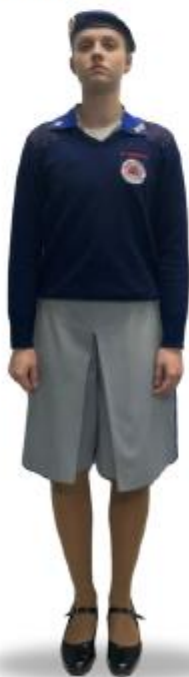
CT2i com Suéter