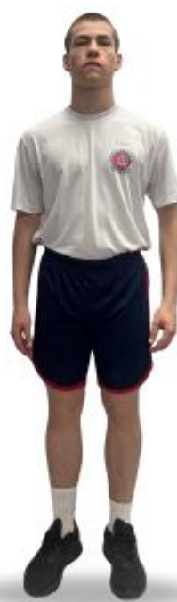
CT3 TAF com Manga Curta