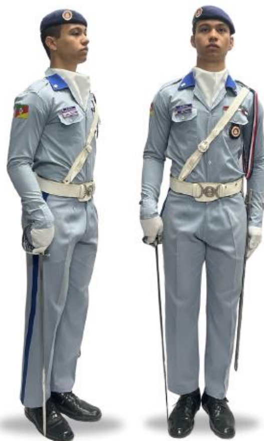
Aluno Disciplina usando uniforme CT2I com talabarte, guia de espada, espada CT, luva branca em tecido e alamar Guarda de Honra.