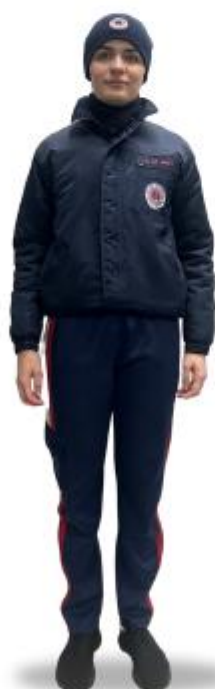
CT3 com Japona, Cachecol e Toca